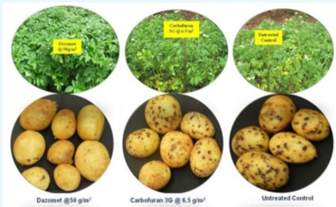
Effect of Basamid 90G on PCN (60 DAP) and tuber borne diseases (120 DAP)

नीलगिरि में आलू सिस्ट सूत्रकृमि के प्रबंधन हेतु रीति पैकेज के भाग के तौर पर रोपण के समय 65 किग्रा./हे. की दर पर कार्बोफुरान 3 G का अनुप्रयोग करने की सिफारिश की जा रही है, हालांकि, यह पीसीएन संख्या की रोकथाम करने में बहुत अधिक प्रभावी नहीं है। इसलिए, किसी वैकल्पिक रसायन की पहचान करने के लिए, भाकृअनुप - सीपीआरएस, मुथोरई, ऊटी में नए मृदा धूमिकारक बैसामिड 90 G का मूल्यांकन किया गया। इसके अंतर्गत गमलों के साथ खेत परिस्थितियों में संवेदनशील किस्म कुफरी गिरधारी पर अनुपचार और कार्बोफुरान के साथ-साथ धूमिकारक की विभिन्न मात्रा यथा 20, 30, 40 एवं 50 ग्राम/वर्ग मीटर का प्रयोग किया गया।