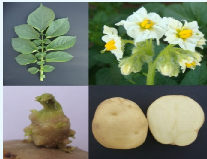
MS/10-1529- पत्ती, फूल, अंकुरण एवं कंद

सीपीआरआई कैम्पस, मोदीपुरम, मेरठ में वर्ष 2008-09 के दौरान एक सेलेक्शन एमएस/10-1529 को क्रॉस एमएस/0-3740 x सीपी 2364 से उत्पन्न किया गया। इस संकर में मध्यम आंखों और दूधिया रंग के गूदे वाले आकर्षक सफेद-दूधिया, गोल-अंडाकार कंद (8-10/पौधा) उत्पन्न होते हैं। 75 दिन की फसल अवधि में 34.33 टन/हे. की कंदीय उपज के साथ प्रगत संकर एमएस/10-1529 में कुफरी बहार (28.01 टन/हे.) में कुफरी गरिमा (29.84 टन/हे.), कुफरी पुखराज (33.22 टन/हे.) और कुफरी सदाबहार (28.75 टन/हे.) के मुकाबले क्रमशः 22.55 प्रतिशत, 15.02 प्रतिशत, 3.34 प्रतिशत एवं 19.41 प्रतिशत की उपज अग्रता प्रदर्शित हुई। हालांकि, 90 दिनों पर एमएस/10-1529 में 46.26 टन/हे. की कुल कंदीय उपज दर्ज की गई जो कि कुफरी बहार (34.02