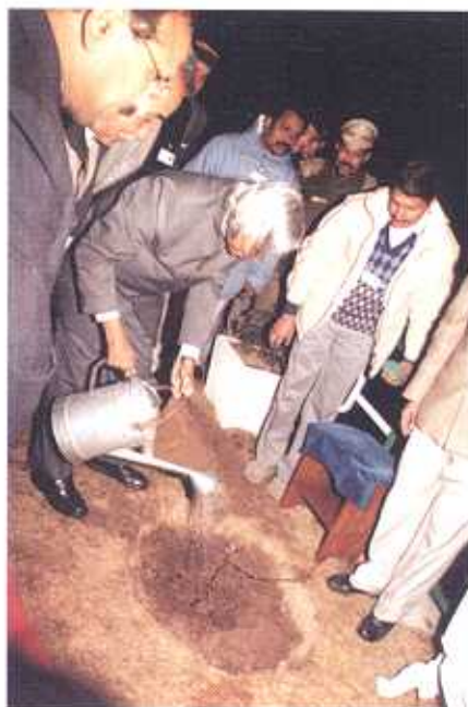
The President planted a sapling of Chinar at Kufri

scientists to develop seed to match with the soil. He warned of water scarcity in coming years, reduction in cultivable land and advised to use biotechnological tools to increase productivity, and develop pest resistance varieties. Besides increasing production by using newer techniques such as biotechnology and nanotechnology, he stressed the need of value addition and proper marketing of the produces specially potato. Dr. Kalam then encouraged the gathering to ask questions. After some hesitations the scientists of the Institute asked questions to the President which he brilliantly answered. It was a lively question-answer session. Dr. Kalam then recited a poem written by him which message was to broaden the mind, keep harmony at home which ultimately leads to world peace. He then asked the gathering to repeat the lines of poem with him as a pledge.