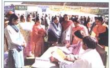
Farmers registration for Kisan Mela

A Kisan Mela on 1 st November, 2004 was organized at CPRI, Shimla. On this occasion information on recent potato production technologies were provided to the farmers. About 100 farmers from different parts of Himachal Pradesh participated in the Mela. Scientists of CPRI delivered lectures on improved potato technologies. Besides, resource persons from NABARD, UHF Nauni, and NBPGR addressed the farmers. A total of 12 exhibition stalls of different organizations related to agriculture and horticulture like IFFCO, NABARD, MARKFED, NSC, etc. were put up which were the main attraction of the Mela. At the end, a Kisan Goshti was organized in which the farmers discussed their problems with the scientists.