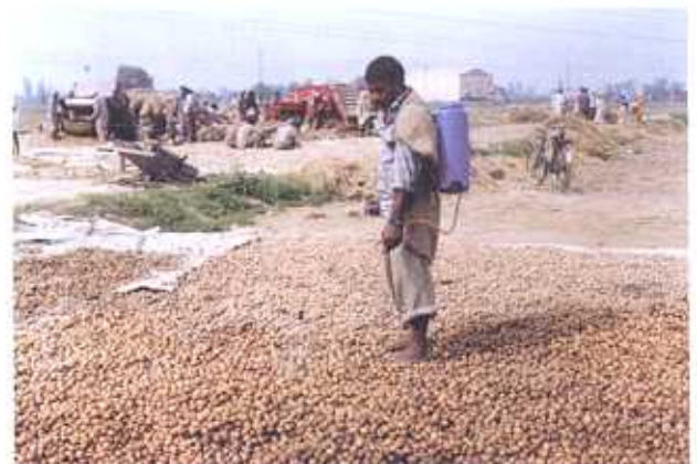
हस्तचालित स्प्रेयर से आलू बीज का उपचार (फोटो जालंधर केन्द्र)

बोरिक एसिड (3%) प्रायोगिक ग्रेड की 45 ग्राम मात्रा को 1.5 लीटर पानी में धोलते हैं यह धोल एक क्विंटल आलू बीज उपचार के लिए पर्याप्त होता है।