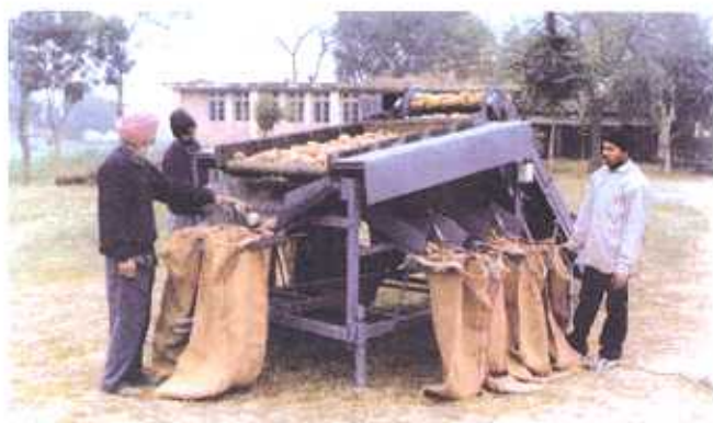
Improved Rubber Roller Type Grader developed at CPRS, Jalandhar

A rubber rollers type of potato grader developed at Central Potato Research Institute, Shimla (HP) can grade six tonne of potatoes in an hour into six categories of