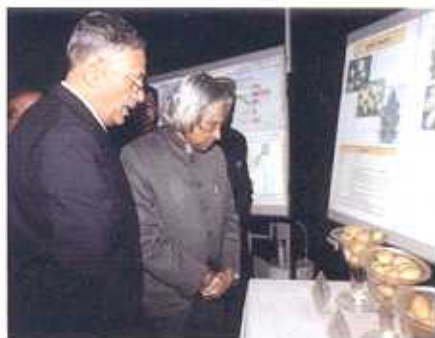
Dr Kalam at the exhibition enquiring about varieties