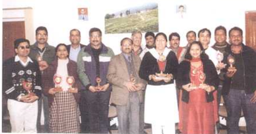
Proud CPRI medal winners with the Director - congratulations