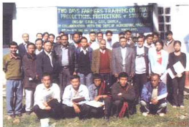
Farmers trainees with resource persons and other officers at Medziphema, Nagaland