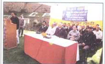
A view of Kisan Goshti