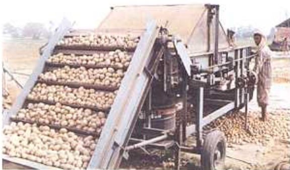
सीड ट्रीटमेंट यंत्र द्वारा आलू बीज का उपचार

संस्थान के मुख्यालय में 14 सितम्बर से 13 अक्टूबर, 2004 के दौरान हिन्दी चेतना मास का आयोजन किया गया। 14 सितम्बर को हिन्दी चेतना मास का विधिवत उद्घाटन संस्थान के निदेशक डा. सत्येन्द्र मोहन पॉल खुराना ने किया। इस अवसर पर संस्थान के सहायक निदेशक (राजभाषा) ने उपस्थित