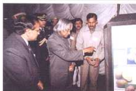
Dr Kalam at the exhibition