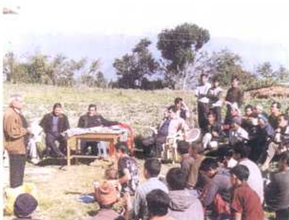
Farmers' training in the field at Perbing (Sikkim)